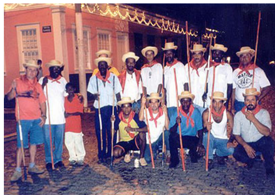
Comunidade de Duas Barras, no Vale do Paraíba, Rio de Janeiro

This historiographic documentary is based on the archives of the UFF Petrobrás Cultural— Memória e Música Negra initiative and chronicles the history of jongos , calangos , and folias in their social context. The film highlights the role of poetry in each of these cultural manifestations as well as in the political legitimization of communities descended from the quilombos of the state of Rio de Janeiro. In Portuguese with English subtitles.